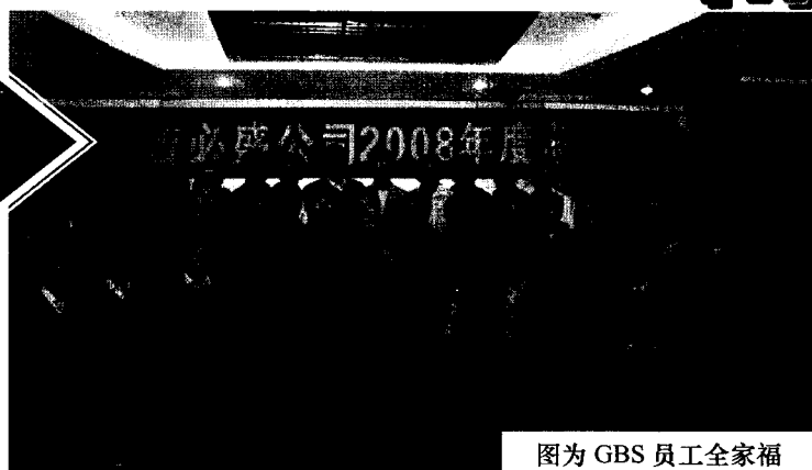
图为 GBS 员工全家福